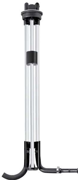
Tankgeber mit Entnahme und Rückführrohr 361 TEA...