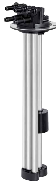
Tankgeber für SCR-Systeme 351 ADBU

Nutzen Sie unsere Online-Konfiguratoren unter www.elobau.com